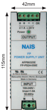
Fuente de Alimentación FP-PS24-050 E